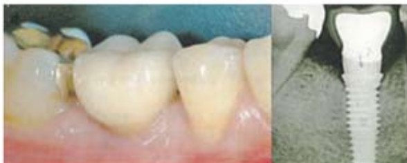
Situation 3: Endsituation der eingesetzten Implantatkrone

■ Implantate haben nicht nur den Vorteil, dass sie so fest wie die eigenen Zähne sitzen, sondern auch vor Knochenschwund schützen. Sie bestehen aus hochreinem Titan. Dies ist ein Leichtmetall. Es ist biologisch neutral, gut gewebeverträglich und löst keine Allergien aus.